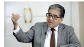
Contralor General de la República, Nelson Shack.

La mayoría de encuestados, el 62.8 %, también opina que Boluarte debe renunciar a su cargo, mientras que un 35.4 % considera que debería continuar como jefa de Estado hasta que se realicen nuevas elecciones.